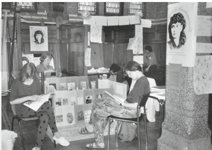
Das AddF bei der International Feminist Bookfair in Amsterdam, 24.-28.06.1992