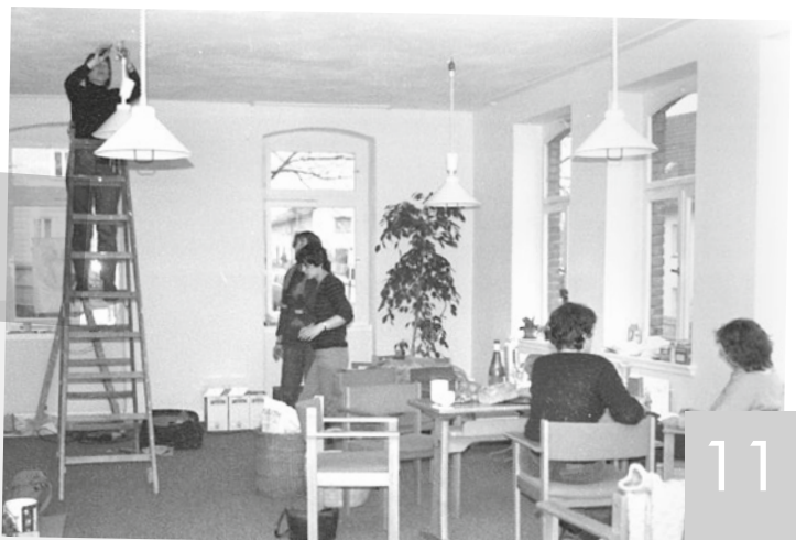
Einrichtung des ersten Lesesaals

Die Forschungsergebnisse werden 2024, pünktlich zum 40-jährigen Bestehen des AddF, Teil einer Publikation. Seien Sie also schon heute gespannt auf die Geschichte des AddF!