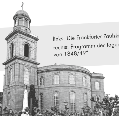
links: Die Frankfurter Paulskirche rechts: Programm der Tagung „Die Modernität von 1848/49“

der Nationalversammlung in der Frankfurter Paulskirche stattfand – ein ganz besonderer Umstand für die Teilnehmenden. Die Tagung hatte das Ziel, die Revolution 1848/49 wieder ins Zentrum der historischen Forschung und der erinnerungspolitischen Auseinandersetzung zu rücken. Hierfür wurden aktuelle Forschungs- tendenzen, neueste fachliche Erkenntnisse und Fragestellungen der Geschichtswissenschaft und weiterer verwandter Kultur- und Sozial- wissenschaften aufgegriffen. Dabei stand die Bedeutung der Revolution von 1848/49 für den Aufbruch Deutschlands in die demokratische Moderne und den Übergang zu einer von akti- ven Bürger:innen getragenen Zivilgesellschaft im Mittelpunkt von acht Sektionen mit insge- samt 30 Vorträgen und einem bunt-gemischtem Rahmenprogramm rund um 1848. Die Tagung war organisatorisch eine echte Mammutaufgabe, die sich aber sehr gelohnt hat.