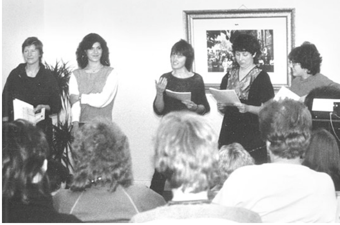
Eine der ersten Lesungen im Philippinenhöfer Weg 83

den – das AddF war eines unter anderen. Welche Ideen und welche Ziele standen hinter diesen Gründungen? Wer engagierte sich damals und wie? Für den akademischen Teil der Frauengeschichte ist inzwischen herausgearbeitet worden, dass die ersten sogenannten Historikerinnentreffen in den 1980er Jahren sehr wichtig waren. Hier traten universitär gebundene Wissenschaftlerinnen für die Umgestaltung der Geschichtswissenschaft ein: Frauen sollten als historische Subjekte sichtbar gemacht werden und die Frauengeschichte in die universitäre Forschung und Lehre integriert werden.